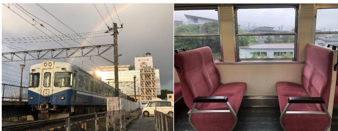
富士急行 1000系 (1202編成)

富士急行株式会社（本社：山梨県富士吉田市、取締役社長：堀内光一郎）では、富士急行線（大月駅～河口湖駅間）を運行する「1000系・1202号編成」の営業運転を、2020年10月28日（水）をもって終了いたします。