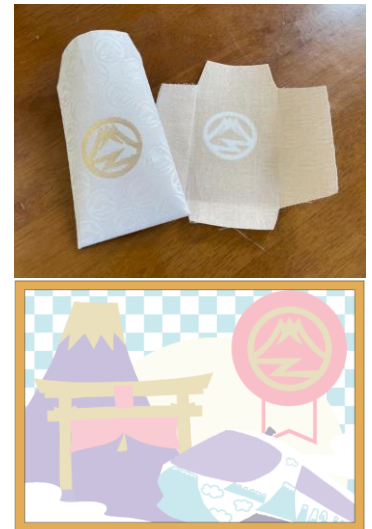
切り布モザイクアート下絵イメージ