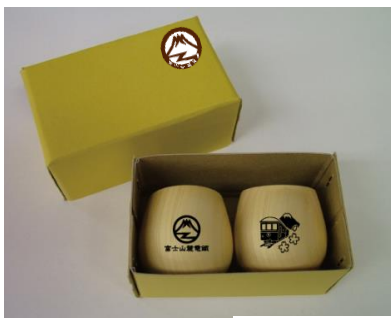
ぐい飲み2個セット

富士山麓電気鉄道の開業にちなんだオリジナルグッズを販売いたします。富士急行と富士山麓電鉄の入場券がセットになった1冊で新旧対比が楽しめる、「全駅記念入场券セット」や、水晶の産地として有名な山梨の宝飾品を活かした「宝石入场券」、地元のメーカーとコラボした記念商品など、今後も鉄道会社の域を超えたオリジナル商品が続々登場予定です。