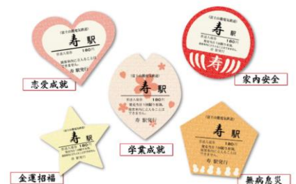
寿駅祈願入场券 各200円