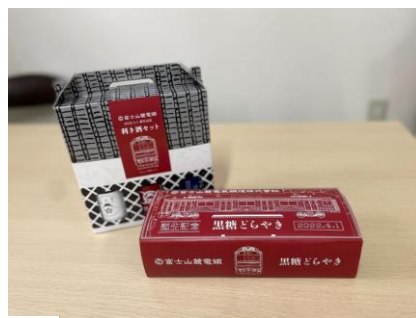
黒糖どらやき（5個入り）1,350円