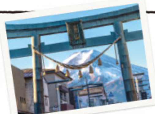
映える写真ならココ!

1900年以上の歴史がある神社で、富士山の女神「木花開耶姫命」を祀っている。富士山吉田口登山道の始まりで、古くから富士山の入口としての役割を担ってきました。11棟の重要文化財、樹齢一千年以上の御神木、木造日本一の大きさの大鳥居など、見所がたっさん。